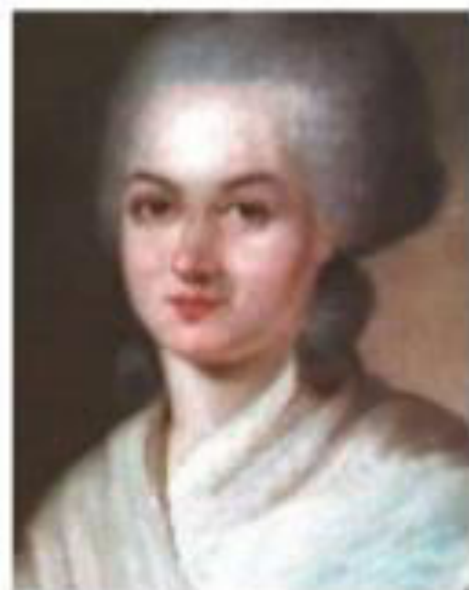
Olympe de Gouges (1791)

Art. 1 : « La Femme nait libre et demeure égale à l'homme en droits »